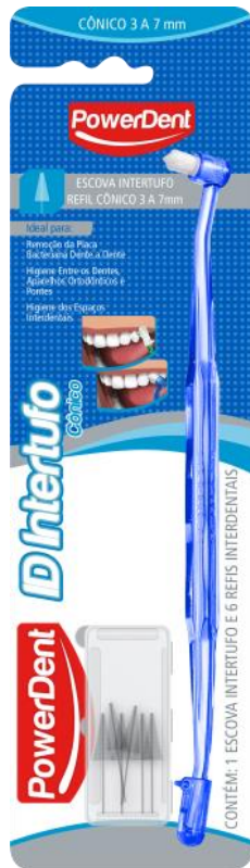
312012 INTERTUFO +REFIL CÔNICO