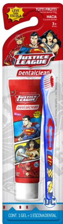
301139 KIT ESCOVA + GEL DENTAL