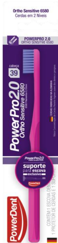
312015 POWERPRO 2.0 ORTHO