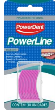
314004 PASSA FIO C/ 30 UN