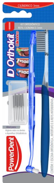
312009 ORTHOKIT + REFIL CILINDRICO