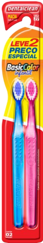
301080 ESCOVA BASIC COLOR MACIA