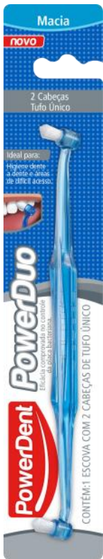
312013 POWERDUO MACIA