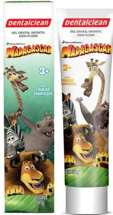
301158 GEL DENTAL | 50g