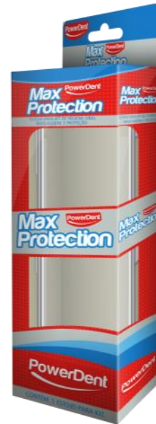
314007 ESTOJO MAX PROTECTION