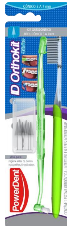
312008 ORTHOKIT + REFIL CÔNICO