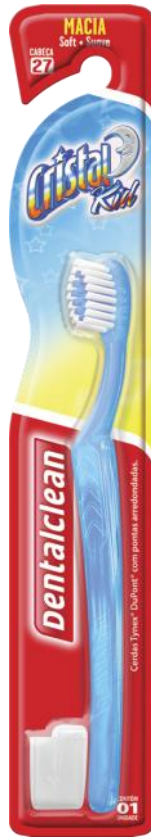
301076 ESCOVA CRISTAL KID MACIA