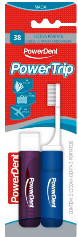
313020 ESCOVA VIAGEM POWERTRIP | MACIA