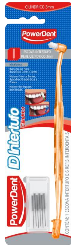
312011 INTERTUFO +REFIL CILINDRICO