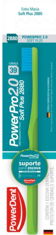
312016 POWERPRO 2.0 SOFT PLUS