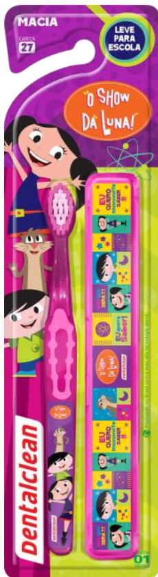
301141 ESCOVA ESCOLAR | MACIA