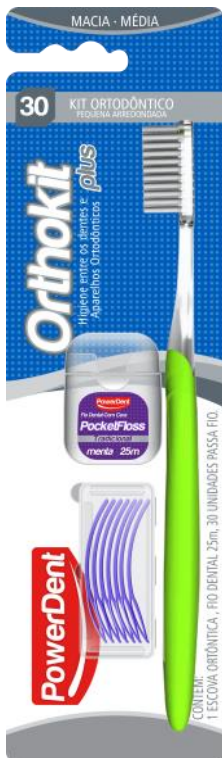
312010 ORTHOKIT PLUS