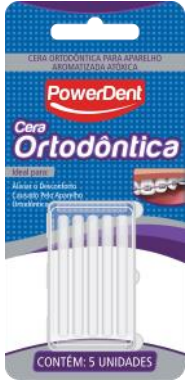
314003 CERA ORTODONTICA