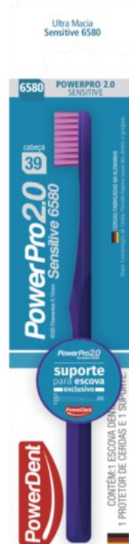
312014 POWERPRO 2.0 SENSITIVE