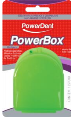
314002 ESTOJO APARELHO