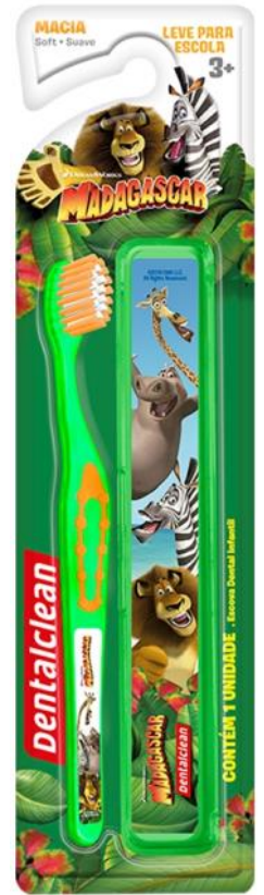
301157 ESCOVA ESCOLAR MACIA