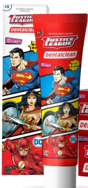
301131 GEL DENTAL | 50g