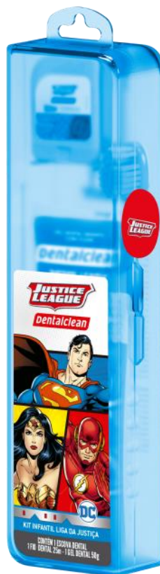
301161 KIT ESTOJO ESCOVA + FIO + GEL DENTAL