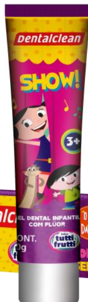
301155 GEL DENTAL 50 GR