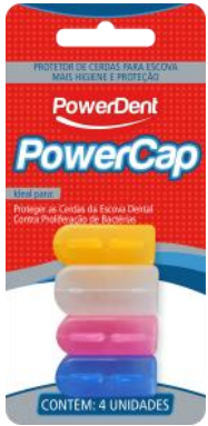
314000 PROTETOR DE CERDAS