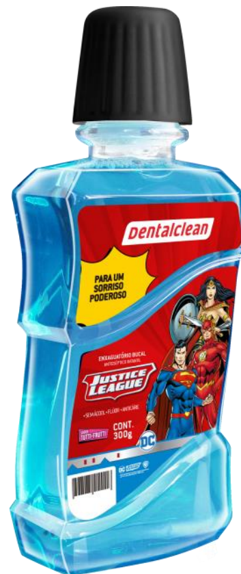
301100 ANTISSÉPTICO BUCAL | 130 ml