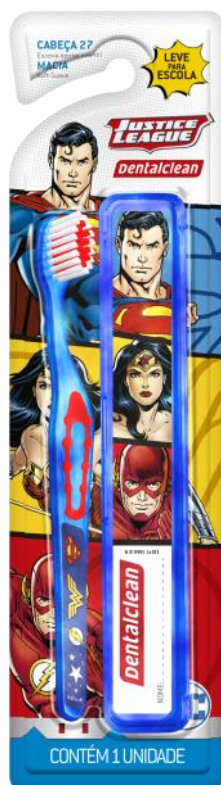
301075 ESCOVA ESCOLAR MACIA