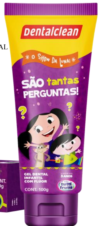
301154 GEL DENTAL 100 GR