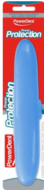
314001 PORTA ESCOVA